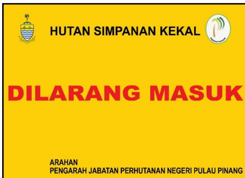
CONTOH PLET SEMPADAN HUTAN SIMPANAN KEKAL